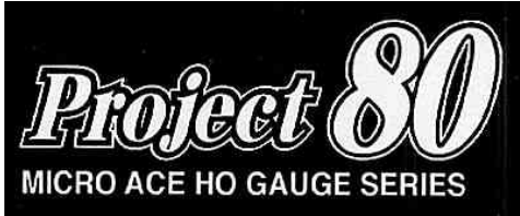
JR東日本商品化許諾済