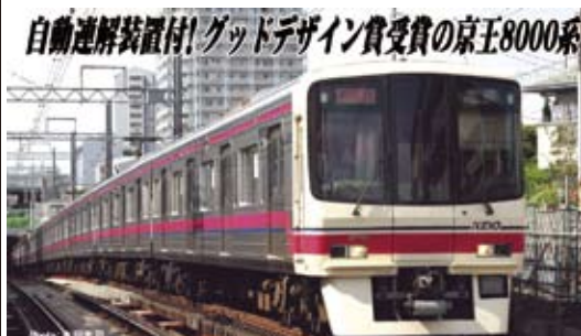
京王電鉄株式会社商品化許諾申請中

1992年に京王電鉄は8000系を投入しました。従来の実用重視のデザインから曲面ガラスを使用した半流線型に一変、同年度のグッドデザイン賞を受賞しました。軽量ステンレス製車体、鋼製前頭部のアイボリー、京王ブルーと京王レッドの車体帯は後に京王線標準となりました。VVVFインバータ制御や車外スピーカーなどの新機軸も多数採用されました。