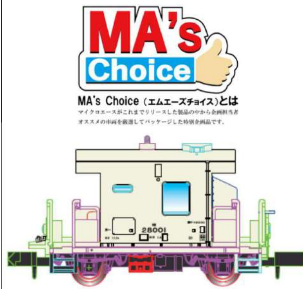
イラストはイメージです