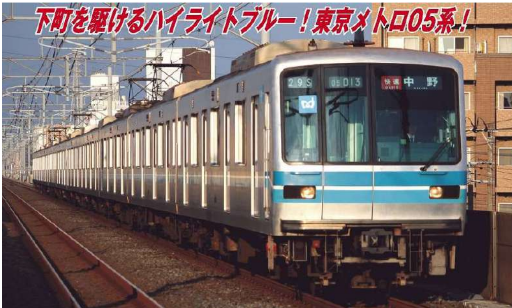
東京地下鉄株式会社商品化許諾済