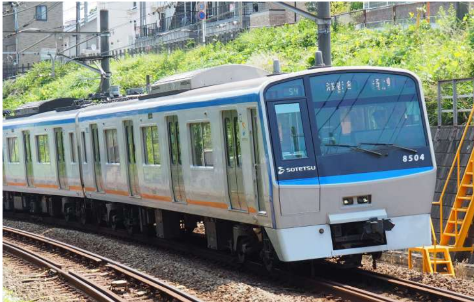
相模鉄道株式会社商品化許諾済