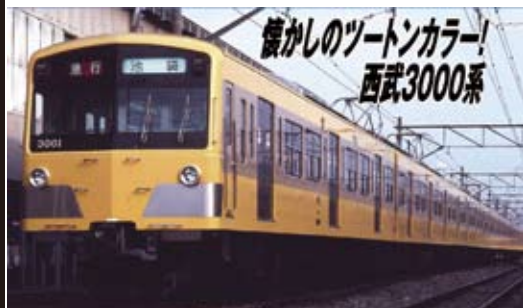
西武鉄道株式会社商品化許諾済

西武鉄道が池袋線用の新型車両として1983年に投入したのが3000系です。当時新宿線に投入されていた4扉車2000系同様に主回路に界磁チョッパ制御を採用、回生ブレーキが使用可能になった点が大きな特徴です。車体は新101系をベースとした普通鋼製20m級3扉で、側面窓が2連1ユニット化された点や前面ブラックフェイス部分中央の柱が無くなった点、前面に車両番号が表記されるようになった点などの相違があります。また、西武鉄道では初めて側面に行先表示器が設置されました。当初は西武イエローをベースに車体側面中央がベージュに塗装されたツートンでしたが、1998年までに西武イエロー一色に改められました。