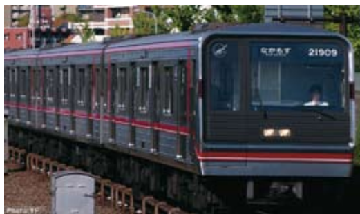
大阪市高速電気軌道株式会社商品化許諾済

大阪市交通局が1990年より投入した新20系は8年間に合計572両製造され非冷房旧型車を一掃、サービス向上に大きな役割を果たしました。