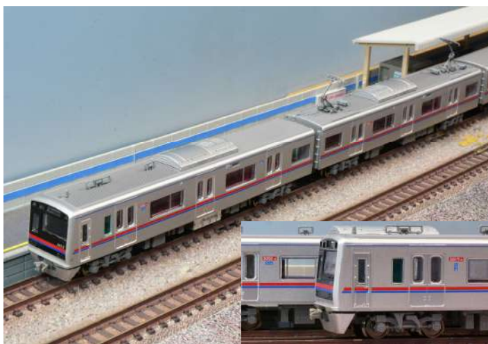
※写真は試作品です