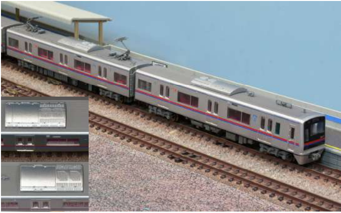
3052Fは三菱製クーラー(写真上) 3017Fは東芝製クーラー(写真下)