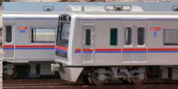
側面ナンバーの位置が若干低い3050形(写真奥)