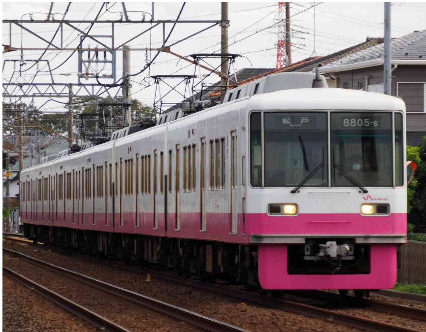
新京成電鉄株式会社商品化許諾済