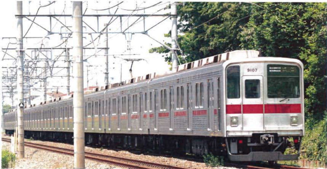
東武鉄道株式会社商品化許諾済