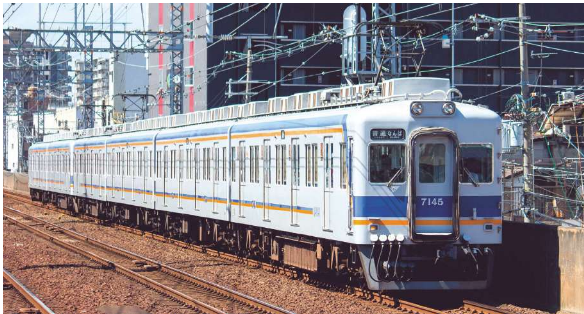
南海電気鉄道株式会社商品化許諾済