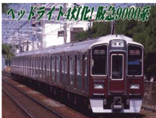
阪急電鉄商品化許諾済

神戸線・宝塚線の旧型車の置換えを目的として、2006年7月に登場したのが阪急9000系です。2003年の京都線用9300系を基本とし、神戸・宝塚線の車体限界に合わせて寸法が変更されたアルミ合金製の車体が採用され、室内は全席ロングシートとなっています。主制御器に東芝製を採用、当初から行先表示器にフルカラーLEDが採用された事や、客室ドア上の室内表示器にLCDが採用されるなど、細部が9300系と異なっています。2013年度までに8両編成11本が登場しており、神戸線用の車両と宝塚線用の車両で運用が区分されています。2013年頃からヘッドライトがLED4灯のものに順次更新されており、外見上の変化が生じました。