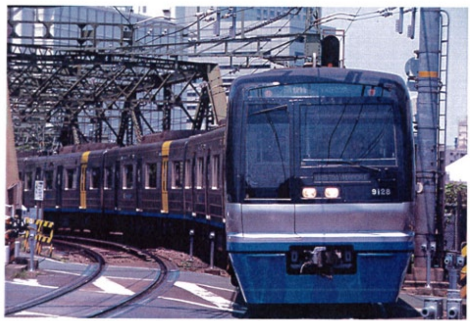
北総鉄道株式会社商品化許諾済 千葉ニュータウン鉄道商品化許諾済