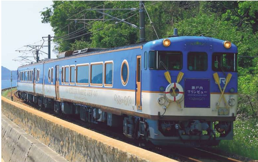
JR西日本商品化許諾済