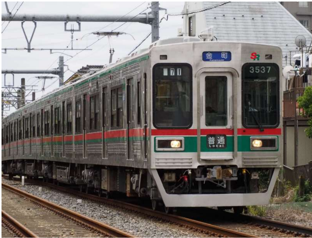
芝山鉄道商品化許諾済