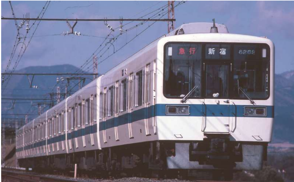
小田急電鉄商品化許諾済