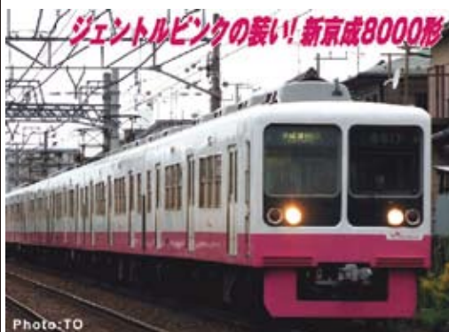
新京成電鉄株式会社商品化許諾申請中

1978年新京成電鉄初の冷房車として登場したのが8000形です。両開きドアや電気ブレーキなどの新機軸のほか、2枚のガラスを用いた前面のユニークなデザインが特徴です。