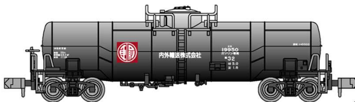
*イラストはイメージです