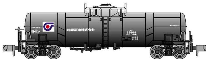
*イラストはイメージです