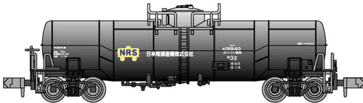
*イラストはイメージです