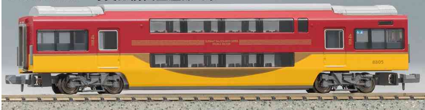
写真は前回生産品です

■ 専用の車体と座席部品を使用し複数のメタリック色調を用いた仕上がりが施されたプレミアムカー