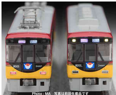
写真は前回生産品です

■ ヘッドライト・テールライトは進行方向に応じて点灯、印刷済みのハトマークを含む各表示器は常時点灯で再現