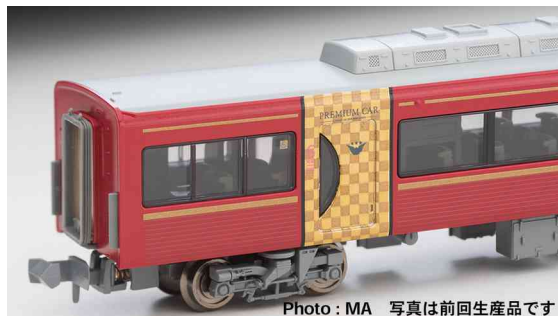
写真は前回生産品です

■ ヘッドライト・テールライトは進行方向に応じて点灯、印刷済みのハトマークを含む各表示器は常時点灯で再現