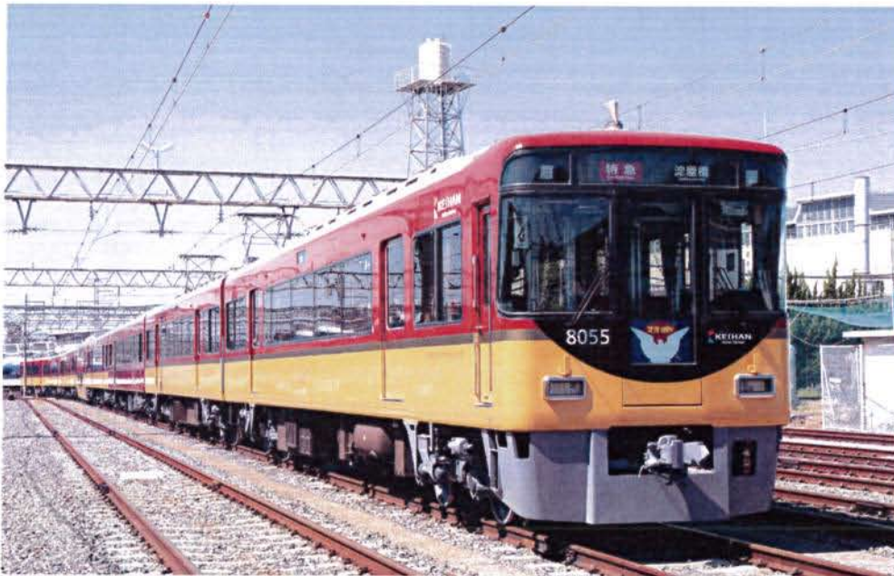
京阪電気鉄道株式会社商品化許諾済