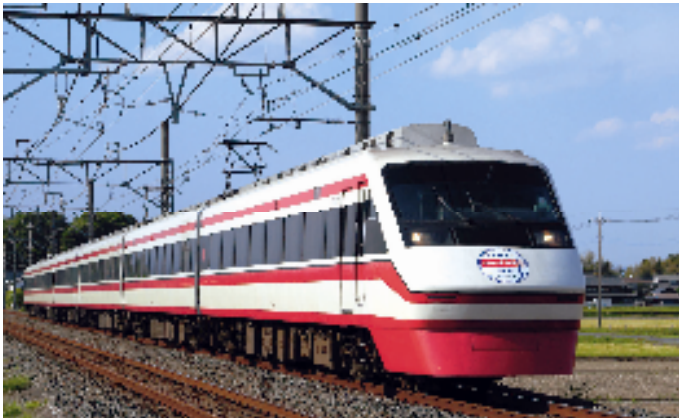
※写真とはパンタグラフ、ヘッドライト位置が異なります。

※本商品の売上の一部を被災地支援のために寄付いたします マイクロエースは被災地の1日も早い復興を応援いたしたく、売り上げの一部を寄付するため本製品を企画しました。 東武鉄道様にもご理解いただいております。