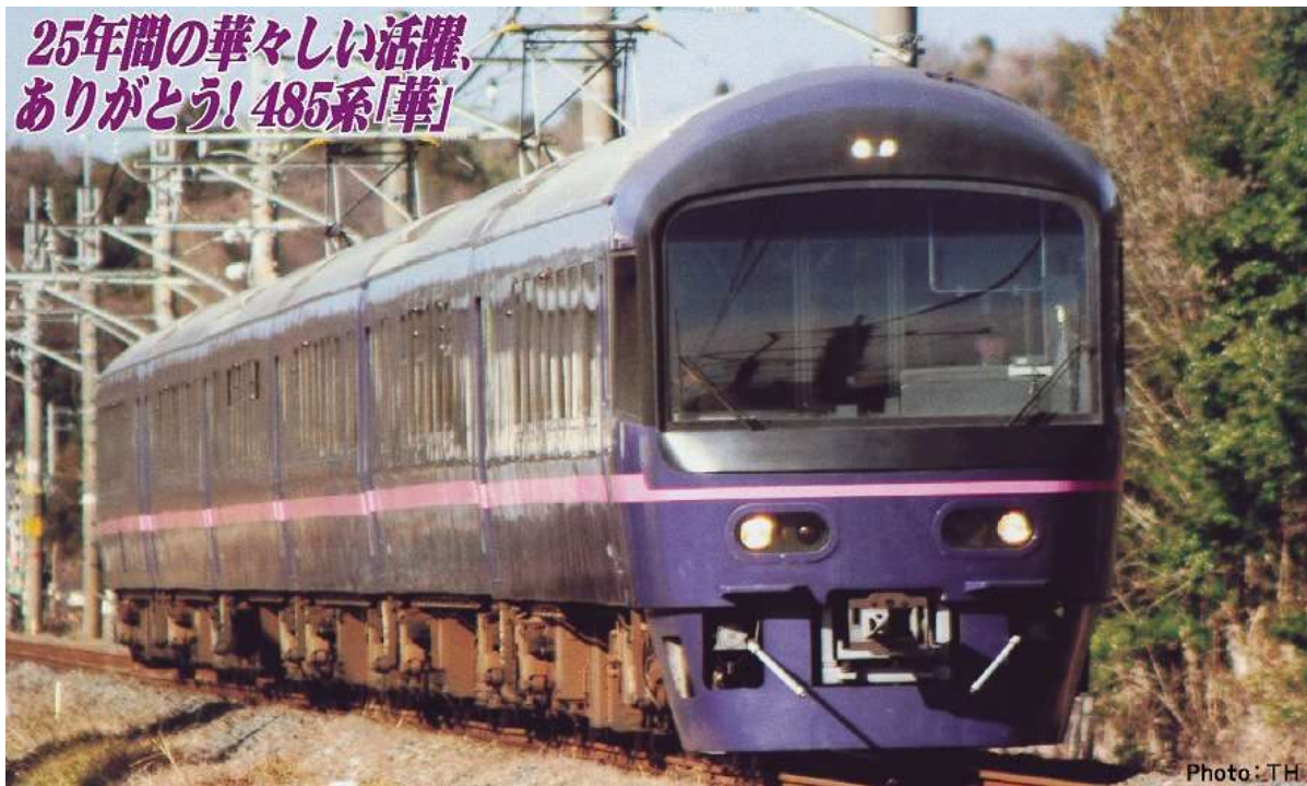
JR東日本商品化許諾済