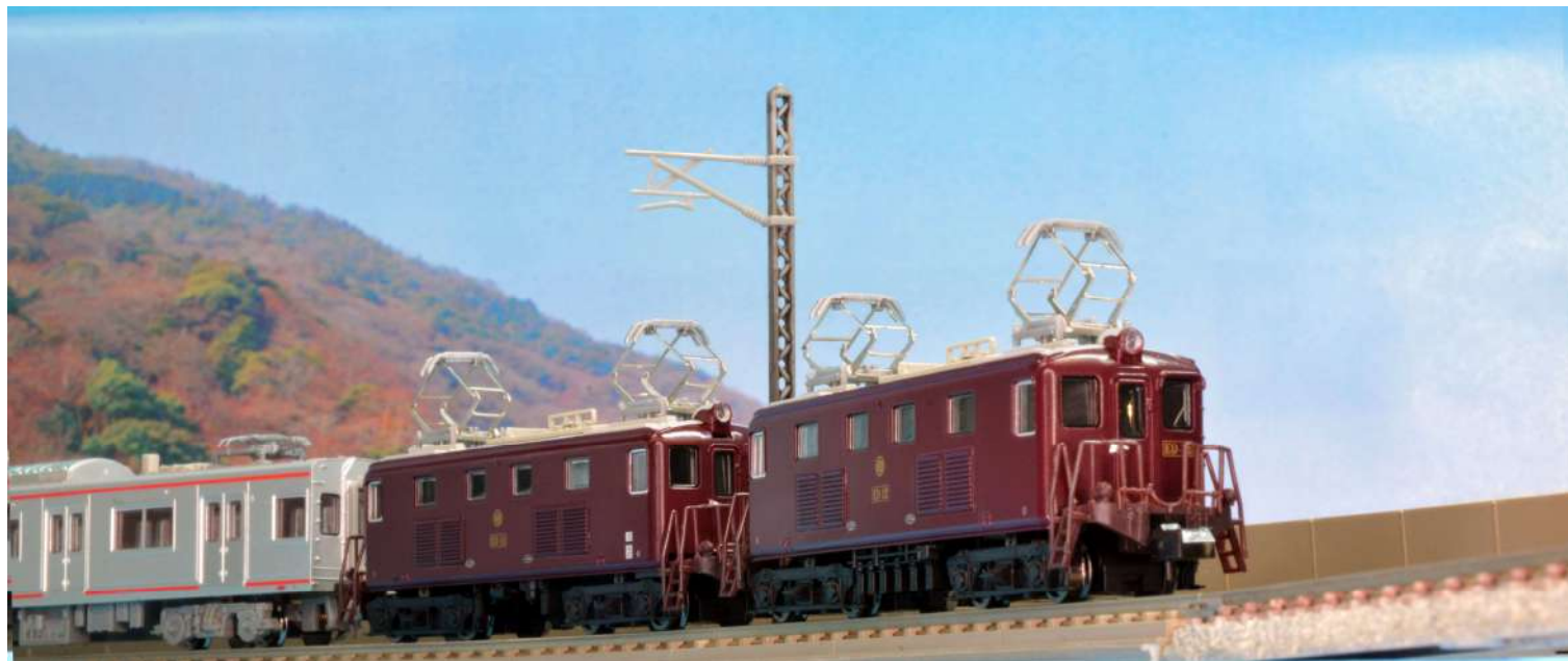
□ 2007年まで車両回送や貨物列車牽引に重連で使われた電気機関車