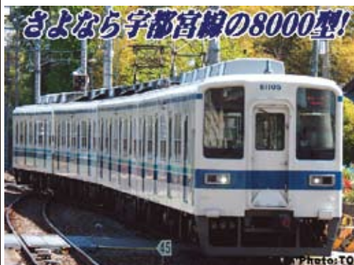
東武鉄道商品化許諾済

1963年から20年間で東武鉄道が私鉄最多の712両を投入した高性能通勤電車が8000型です。20m普通鋼製の切妻車体には片側4箇所両開き扉を設置、戸袋窓や電気制動の省略など軽量化と量産に適した設計により増大し続けた輸送需要に対応しました。 1972年製のグループから冷房を搭載、1976年製のグループから台車を変更するなど製造年次ごとの細かい差異が見られます。 1985年から順次塗装をジャスミンホワイトに濃淡ブルーの帯を配したものに変更、翌年より車体修繕工事を開始、前面形状の変更や側面方向幕の設置などが行われました。修繕工事も長期間に亘り施工年次毎の差が多く、後年に修繕されたグループでは行先表示のLED化やヘッドライトのHID化など外見上の相違が見られます。