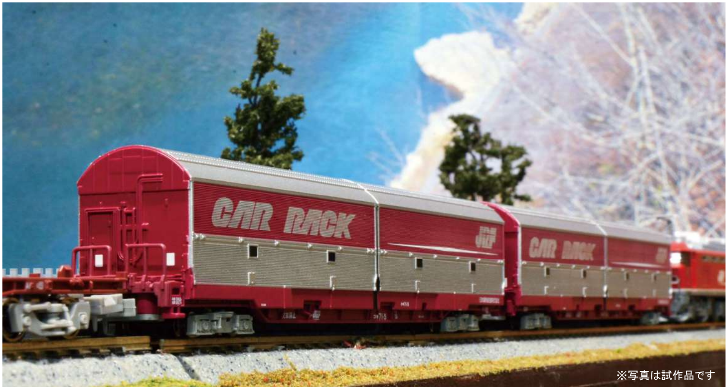
※写真は試作品です JR貨物承認済