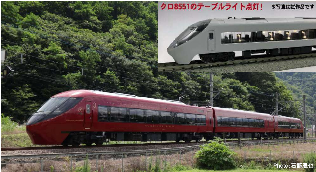
富士山麓電気鉄道株式会社商品化許諾済 株式会社ドーンデザイン研究所商品化許諾済