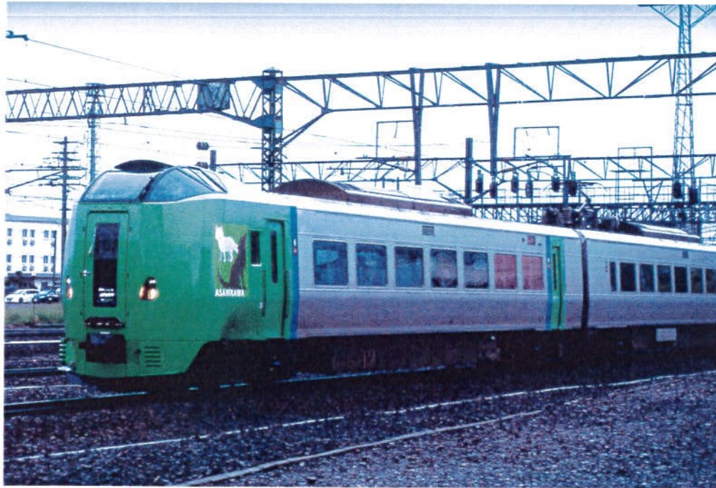
JR北海道商品化許諾済