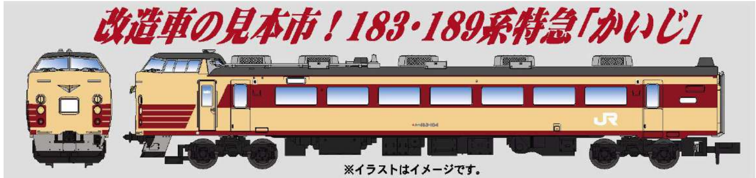
※イラストはイメージです。